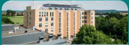
Klinik Bad Windsheim