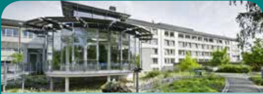
Klinik Neustadt an der Aisch